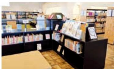
子育ての本や情報リーフレットがあるテーマ展示コーナー