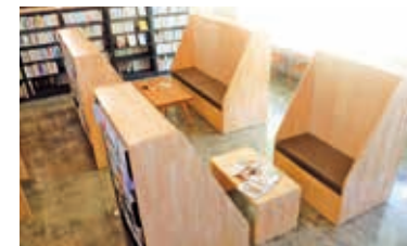
本を広げて会話を楽しめる読書席