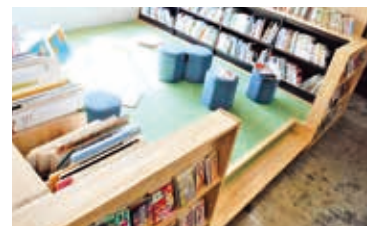
日あたりのよい読み聞かせコーナーは絵本や紙しばいを楽しめます