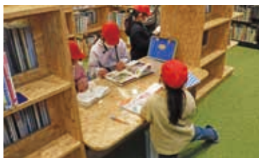
親子で読書や勉強ができる児童エリア

牧之原市立図書交流館は、民間施設のなかで子育て支援センターと同居しています。図書交流館のなかには、子どもたちへ絵本を読み聞かせできるスペースやゆっくり読書できるソファ席、大人も学生も読書や勉強ができる席をそろえています。また、フタ付きの飲み物を持ち込むことができ、利用するみなさんと会話を楽しんだり、子どもたちが本を読む声が聞こえたり、楽しみかたがいろいろあります。子どもも大人も交流できる図書交流館では、季節ごとのイベントや図書の特集展示をご用意しています。