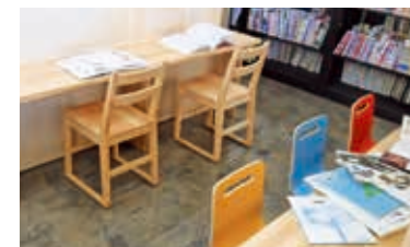
友だちといっしょに、本を広げて本の世界へとびこもう