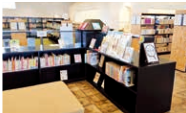
子育ての本や情報リーフレットがあるテーマ展示コーナー