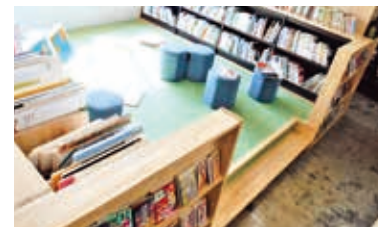
日あたりのよい読み聞かせコーナーは絵本や紙しばいを楽しめます