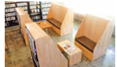
本を広げて会話を楽しめる読書席