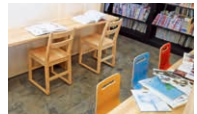
友だちといっしょに、本を広げて本の世界へとびこもう