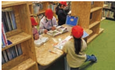
親子で読書や勉強ができる児童エリア

牧之原市立図書交流館は、民間施設のなかで子育て支援センターと同居しています。図書交流館のなかには、子どもたちへ絵本を読み聞かせできるスペースやゆっくり読書できるソファ席、大人も学生も読書や勉強ができる席をそろえています。また、フタ付きの飲み物を持ち込むことができ、利用するみなさんと会話を楽しんだり、子どもたちが本を読む声が聞こえたり、楽しみかたがいろいろあります。子どもも大人も交流できる図書交流館では、季節ごとのイベントや図書の特集展示をご用意しています。